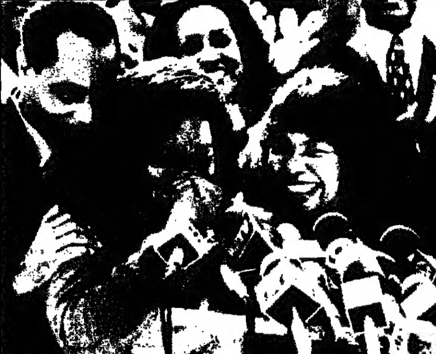
.. ولقولة أخرى من الفلم (القدس العربي)